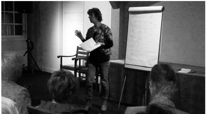
Theorieles in het Streekmuseum.

Op zaterdag 23 november 2013 werd een trainingscursus voor Hoeksche Waardse museumrondleiders succesvol afgesloten met een praktijkles op Tiengemeten. Zesendertig vrijwilligers lieten zich tijdens de meerdaagse rondleiderstraining onderwijzen en inspireren door Francesca Estourgie, die gespecialiseerd is in de presentatie van museumrondleiders. De rondleiders zijn verbonden aan vijf musea in de Hoeksche Waard: het Streekmuseum in Heinenoord, Museum Het Land van Strijen, Museum Het Oude Raadhuis in Oud-Beijerland en op Tiengemeten het Rien Poortvliet- en het Landbouwmuseum.