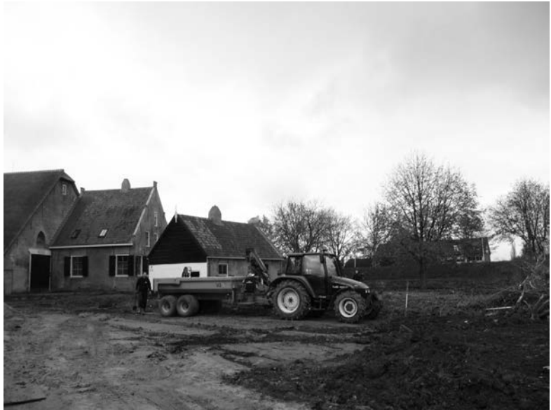
Gekeerde grond rond boerderij Oost-Leeuwenstein december 2013

Die mijlpaal zullen wij grotendeels te danken hebben aan de groep Adlib (collectiebeschrijving), fotografen, scanners, textiel en sieraden en de groep ICT. Zo ziet u maar wat er zoal voor of achter de schermen gebeurt in het streekmuseum. Ook al lijkt er van buitenaf misschien weinig te veranderen.