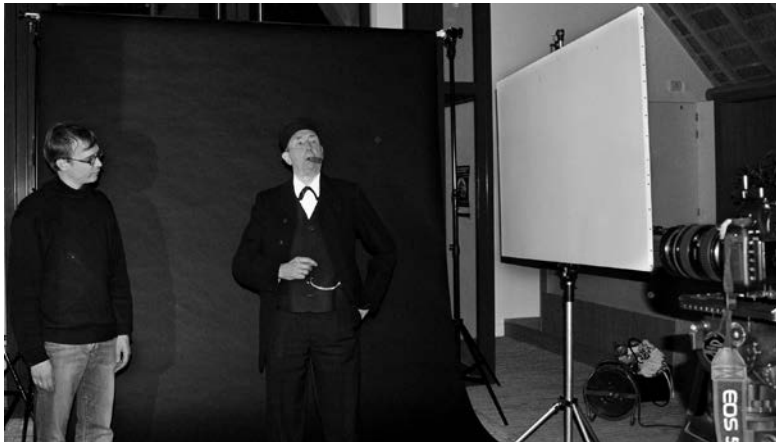
fotoshoot 23 december 2013 in boerderij Oost-Leeuwenstein

Het resultaat van deze dag ziet u vlak voor en rond de heropening van de boerderij in april. De portretten zullen op posters en in het museum te zien zijn.