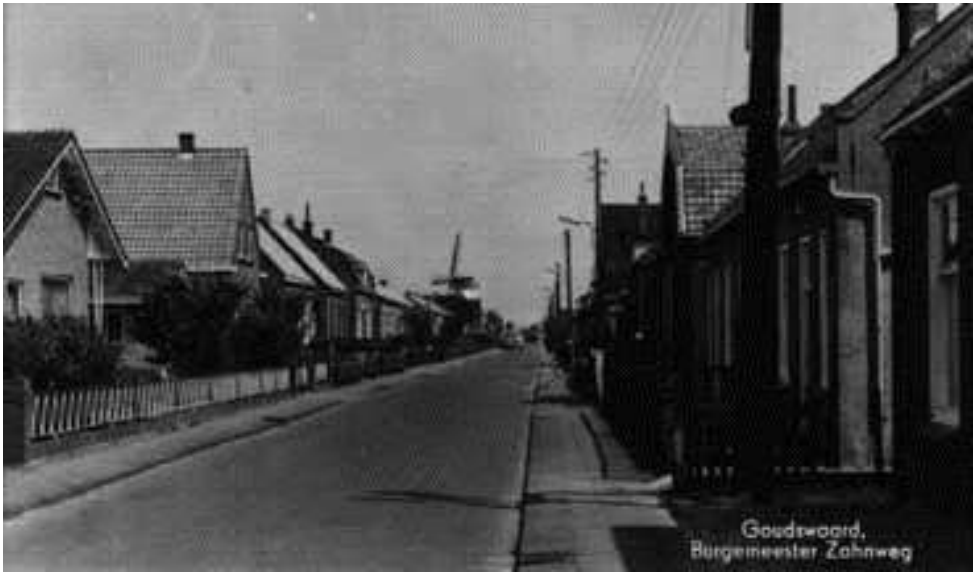
Godswaard, Bergemeester Zahnweg