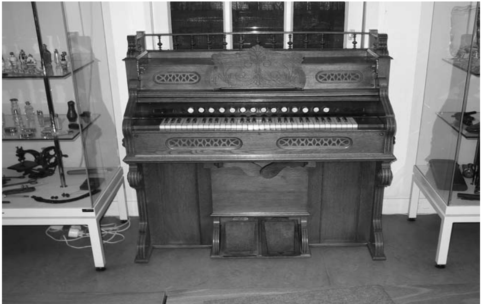
Het Amerikaanse Worcester-orgel uit 1909