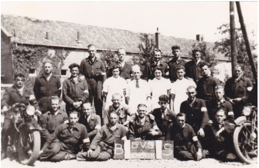
De groep Binnenlandse Strijdkrachten te Heinenoord