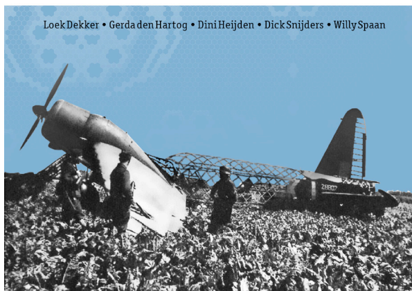
Omslagfoto Wellington Z8807 na de noodlanding op 7 augustus 1941 aan de Eerste Kruisweg, Oud-Beijerland. (Omslagontwerp Gerco Kolbach)