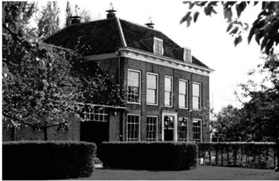
Drie voorbeeldige monumenten zien in één wandeling? Dat kan in en om Heine Noord met het Leeuwenstein arrangement. Het fraaie Streekmuseum is er onderdeel van.

Voor één aantrekkelijke prijs kom je langs uniek cultureel erfgoed, zoals de Molen van Goidschaloord en de kleinste watertoren van Nederland. De route is genoemd naar de drie boerderijen die te bewonderen zijn, namelijk Oost-, Midden- en West-Leeuwenstein. Aan de Hofweg in Heine Noord bevinden zich de Nederlands Hervormde Kerk uit de 15e eeuw en 't Hof van Assendelft, waar het Streekmuseum Hoeksche Waard gevestigd is. Drie unieke culturele partners bieden