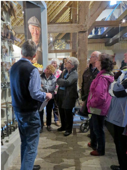
Publieksdag 3 mei.

Vedder sting in dut vertrek 't fornuis, waerop gekookt, gebakke en gebraeje wier en waer ok 't drôôgrekkie omhene gezet kon worre om 't wasgoed te drôôge as tat buite nie kon. En dan was t'r netuurlijk de geutstêen nog, mè waoter uitte regenpit of -hêël medern, añze opte waoterlaaiding añgeslote waere- uitte kraon, waer allêen koud water uikwam. As ze nied al te wijd bij 't durp vandaen zatte hááñze ok nog -erg luuks!- een gasañsluiting voor koke en verlichting. Hêêlemael achter an d'n dijk moste ze 't nog hêël lang doen med olielampe en