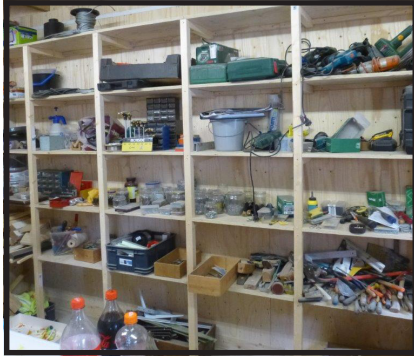
Stellingen in de werkplaats voor gereedschap en dergelijke.