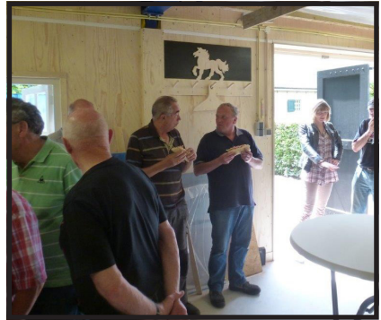
Ook aan de versiering van het interieur is aandacht besteed.