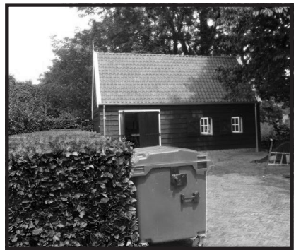
De nieuwe werkplaats.