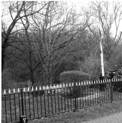
Hectometerpaaltjes aan de Sluisendijk in Heinenoord