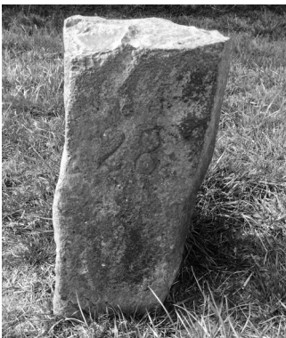
Raaipaal aan de Spuidijk bij Nieuw-Beijerland