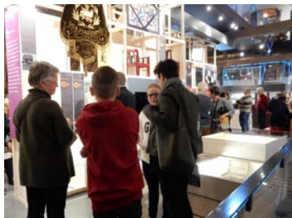
Opening voor de museumvrijwilligers.