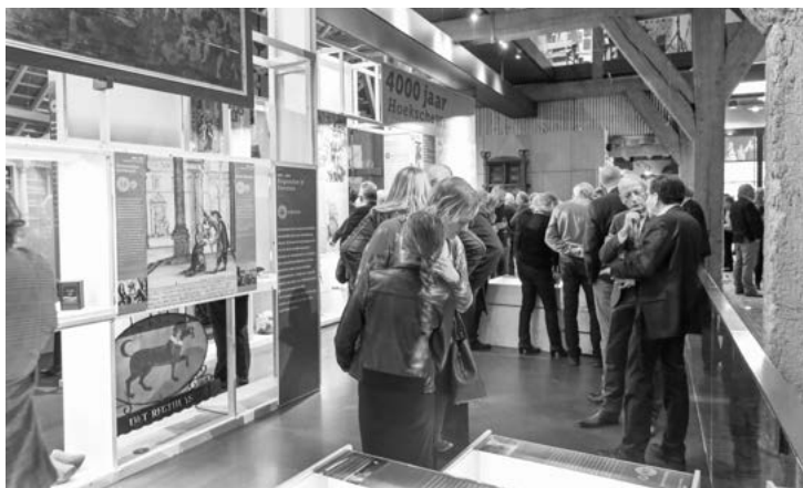
Bezoekers van de Expo.

Voor nadere informatie over de activiteiten kunt u de website raadplegen: www.museumhw.nl