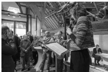
Opening expo, Belle spreekt het openingswoord.

Op 16 en 17 maart hebben we officieel de nieuwe expositie '4000 jaar Hoeksche Waard' geopend, die gebaseerd is op die speciaal opgestelde Canon van de Hoeksche Waard. Eerst op vrijdag met de burgemeesters van de Hoeksche Waardse gemeenten en allerlei relaties van het museum. Op zaterdagochtend met een groot deel van onze 155 vrijwilligers. Twee zeer geslaagde bijeenkomsten, die ik extra feestelijk vond door de muzikale begeleiding en intermezzo's van resp. de Zusjes van Wanrooy op vrijdag en de Polderzangers Den Driesprong op zaterdag. Er zit veel muziek in ons museum en in de Hoeksche Waard.