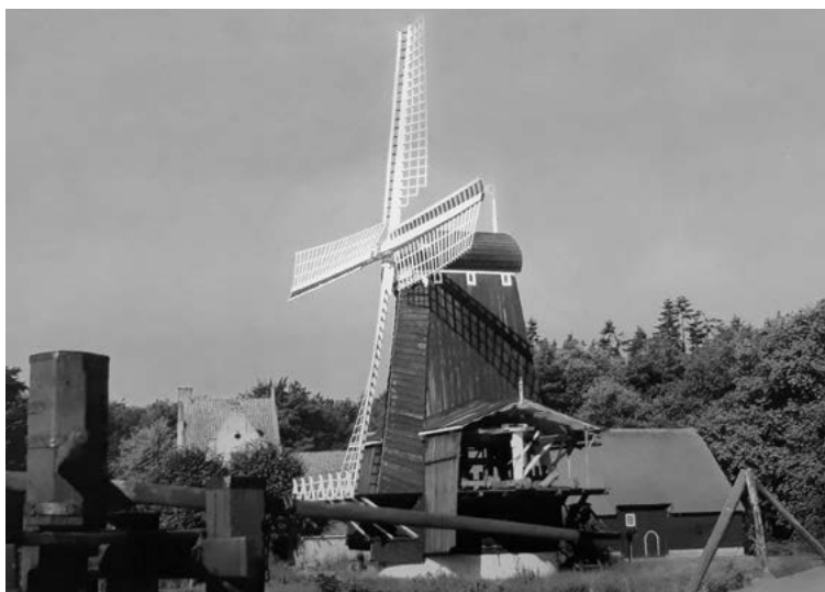
De paltrokmolen in het Openluchtmuseum.

Een paltrokmolen is een houtzaagmolen die zijn naam dankt aan zijn vorm. Zowel links als rechts zien we aan de eigenlijke molen een aanbouwsel om de lange boomstammen te kunnen bergen. Hierdoor kreeg de molen een vorm die enigszins leek op de in de 16 de eeuw in de mode zijnde jas die door mannen gedragen werd en “paltrok” werd genoemd.