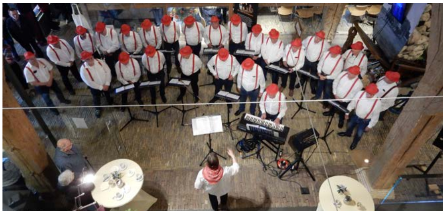
Optreden van Polderzangers Den Driesprong tijdens de opening voor de vrijwilligers.