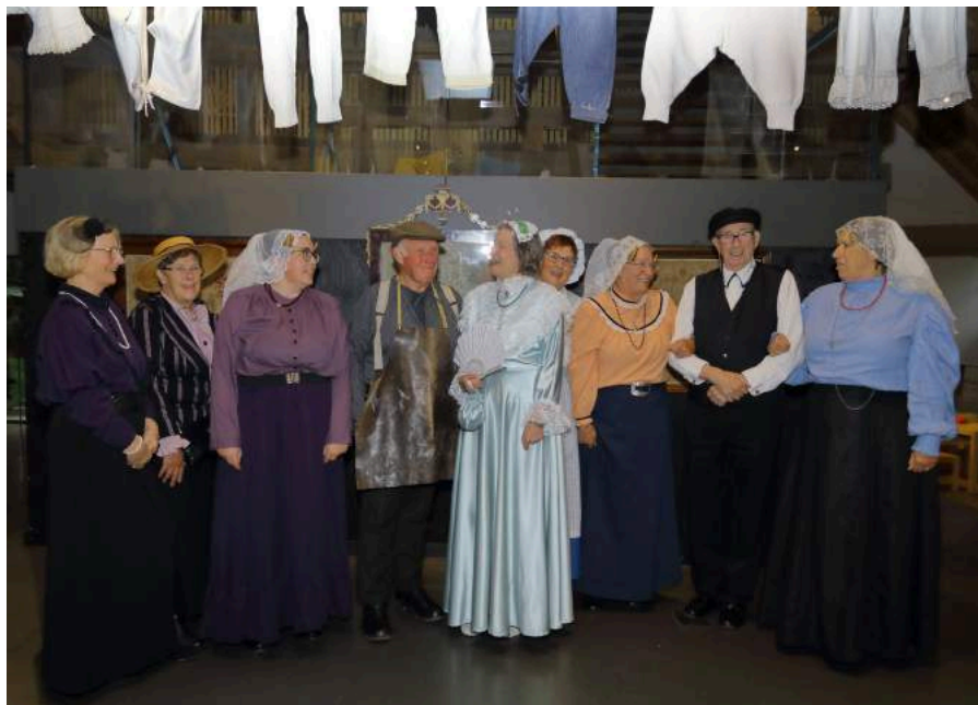
Een aantal vrijwilligers in klederdracht geven de opening een feestelijk accent.