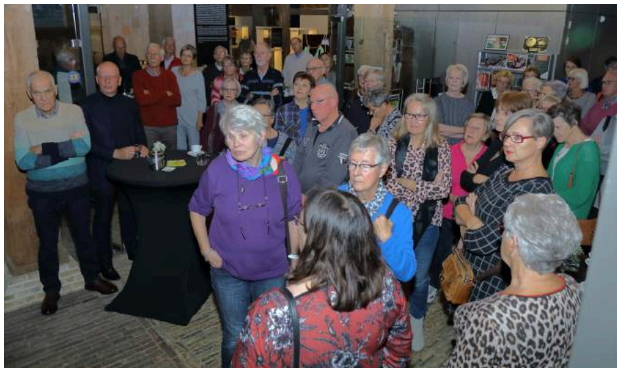
De vrijwilligers luisteren naar toelichting op de expositie door de directeur.