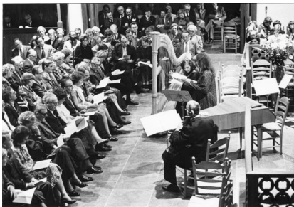
Het jubileumconcert in de Ned. Herv. kerk van Heinenoord, gezien vanaf de orgelgalerij.