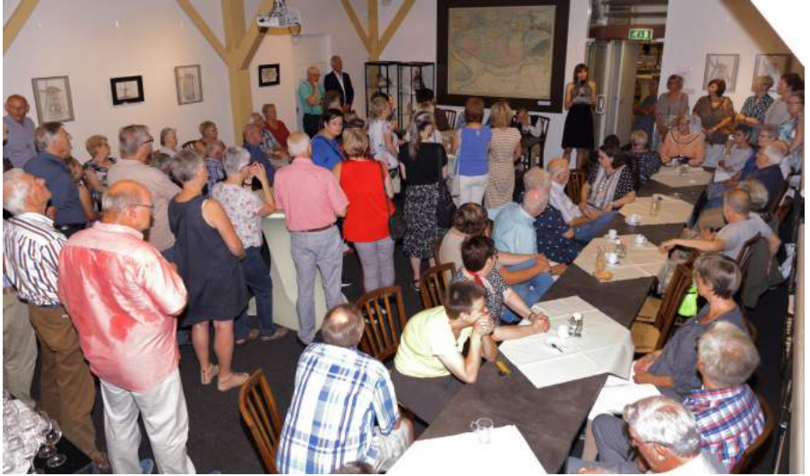
Belle neemt 's avonds afscheid van de vrijwilligers.