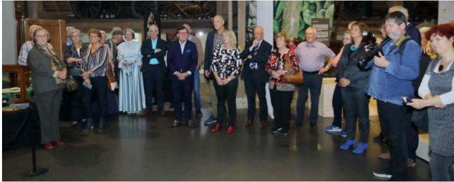
Genodigden bij de opening van de expositie.