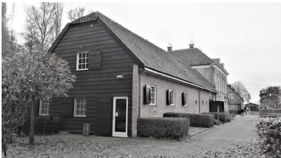
Oostgevel na de vergroting van de schuur met het documentatiecentrum. Opname uit 2019.