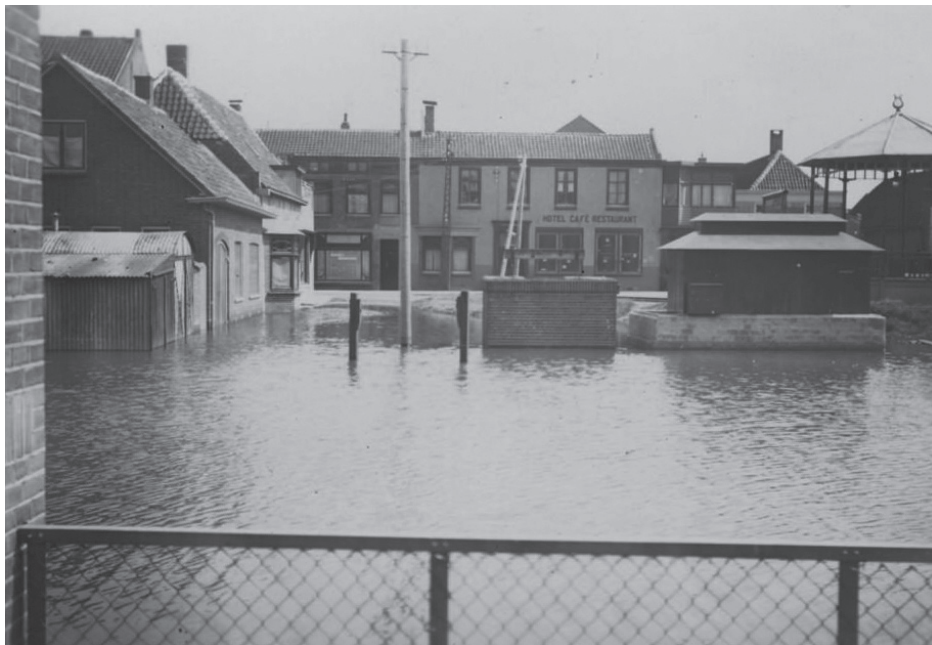
De Voorstraat en het Plein gezien vanaf de Havenstraat met de muziektent

De watermassa bruist naar binnen en de Duitse wachtposten d.w.z. de Russen, die de sluizen hebben geopend, vinden het bepaald amusant, hetgeen te zien is aan de glimlach op hun Aziatische