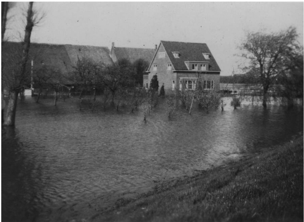
"De ondergelopen hoeve 't Land in Zicht aan de Middelsluisdijk WZ te Numansdorp "