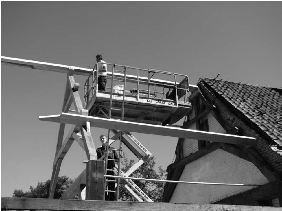
DE NIEUWE BINTEN WORDEN OP AANGEBRACHT