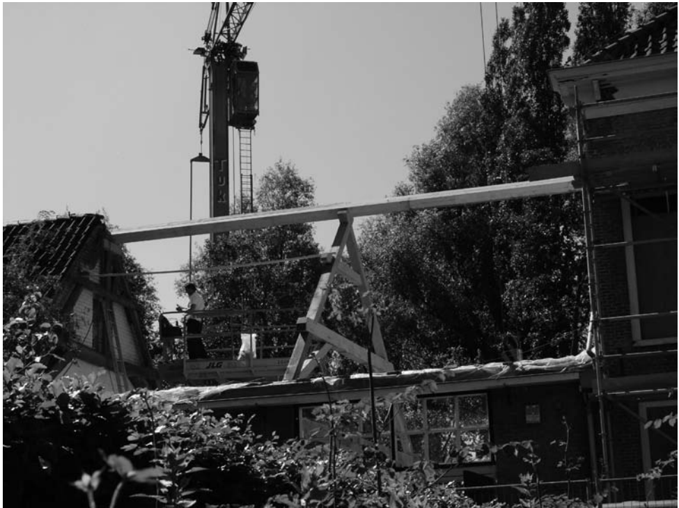
EEN SPECTACULAIRE KLUS