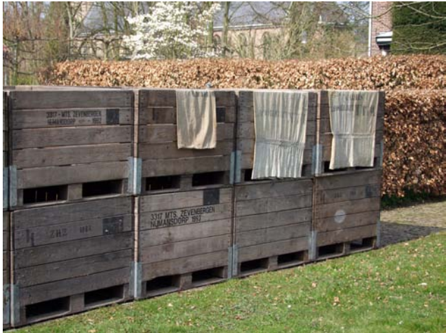
IN DEZE KISTEN WORDEN DE OBJECTEN VERVOERD.