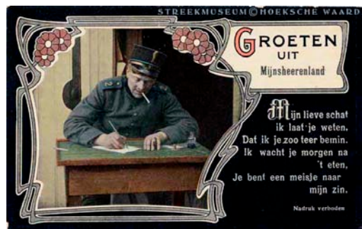
EEN ANZICHTKAART MET EEN GROET UIT MIJNSHEERENLAND. DE TEKST LUIDT: