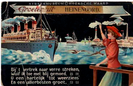
EEN ANSICHTKAART MET EEN GROET UIT HEINENOORD. DE TEKST LUIDT:

Concluderend, een professionaliseringsslag ten aanzien van de collectie is in de komende tijd nodig. Met dit plan is een eerste stap gezet in de richting van een inzichtelijke collectie die nieuwsgierig maakt, informatie geeft, gevarieerd is en om die reden meer dan de moeite waard is om bewonderd te worden door de bewoners van de Hoeksche Waard en daarbuiten.