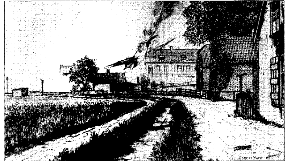
Bovenstaande tekening van het neerstorten van Wells is -later- door een ooggetuige gemaakt.

Een tweede toestel komt met een luide klap neer in de buurt van Hoogvliet. Beide inzittenden komen om. Zij liggen begraven op de algemene begraafplaats te Spijkenisse. Een derde Blenheim stort bij Waalhaven neer. Ook hier zijn geen overlevenden. De twee bemanningsleden zijn op Crooswijk begraven. De piloot van de vierde jager slaagt er in om zijn zwaar gehavende machine bij het dorp Herkingen op een modderbak te zetten. De twee officieren zijn slechts licht gewond. Nederlandse soldaten nemen hen mee naar Oud-Beijerland.