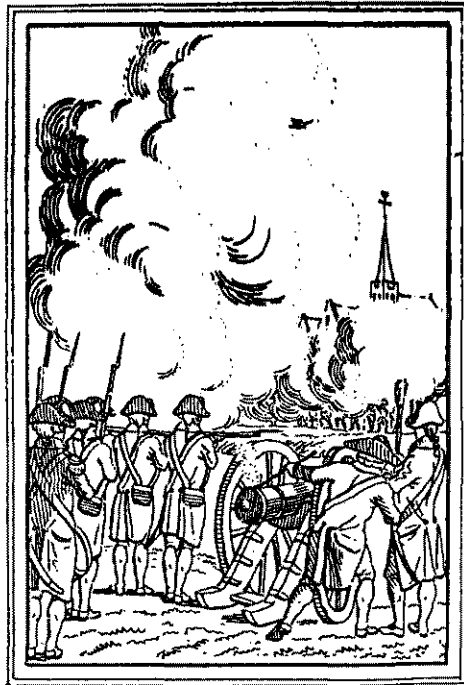
Dordrechtse Burgers te Oud-Beijerland.

Intussen is er door een paar ingezetenen aan Dordrecht om hulp gevraagd. Daaraan wordt onmiddellijk voldaan. Onder aanvoering van de kapitein der schutterij van St. Joris trekken 80 man, met twee stukken geschut, op naar Oud-Beijerland. De volgende morgen om 7 uur komen ze bij het dorp aan. Daar is men nog bezig met plunderen, maar al gauw trekt men op tegen de schutters die vanuit de ramen en van de hoeken der straten onder vuur genomen worden. De schutterij is nu wel verplicht het geschut in stelling te brengen, niet zozeer om bloed te vergieten als wel om schrik aan te jagen.